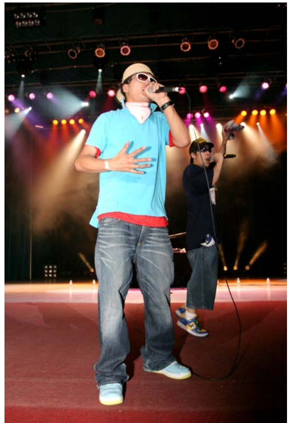
フューチャーショック