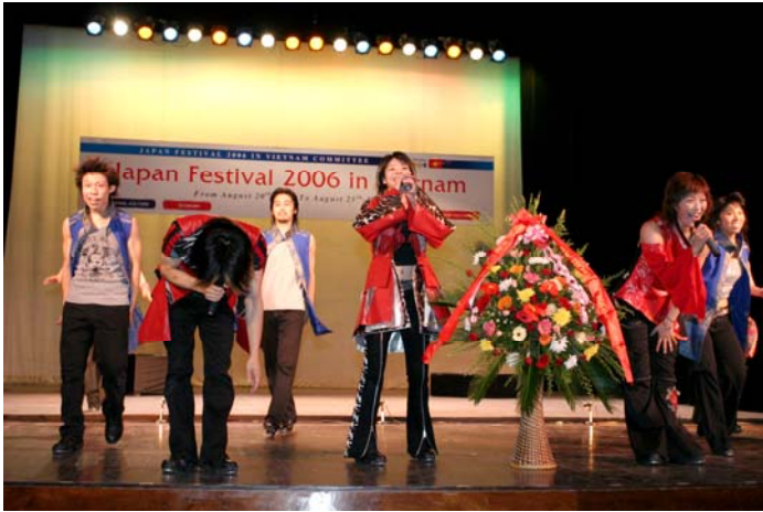
リズムコレクション