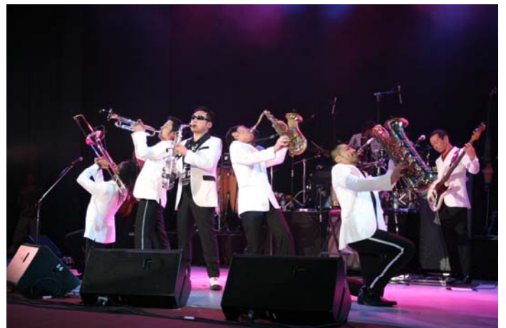
東京スカパラダイスオーケストラ