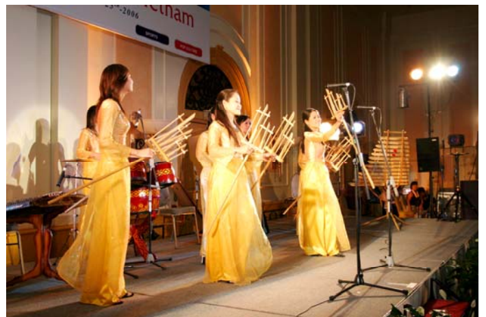
HOA CHAN AN