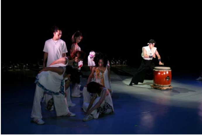
ケイブロードウェイ