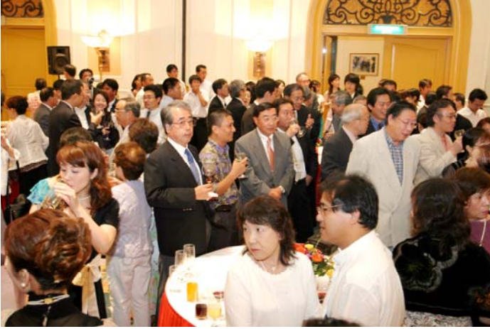
オープニング風景