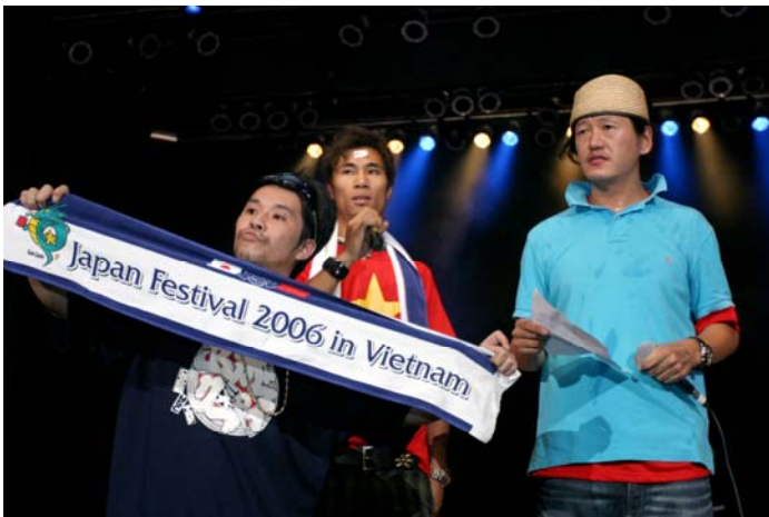
フューチャーショック