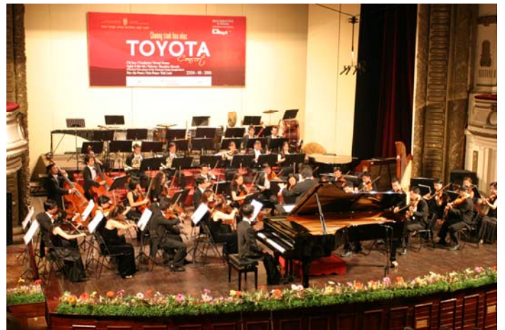
ベトナム国立交響楽団