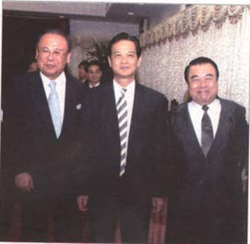
Prime Minister Nguyễn Tấn Dũng (center) poses with the Japanese delegation members.