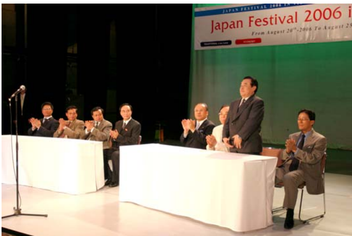
冬柴鐵三 公明党幹事長