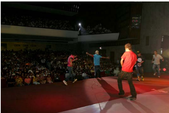
フューチャーショック