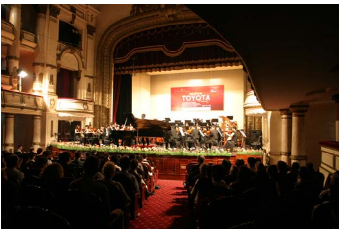
オペラハウス会場