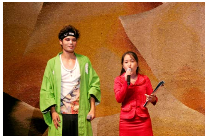
バンブーレボリューション