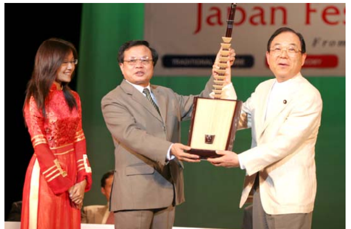
ベトナム側から記念品の贈呈