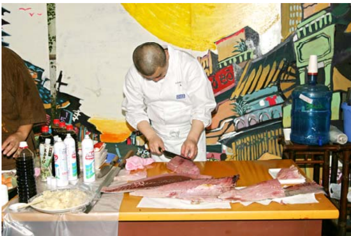
まぐろ解体ショー