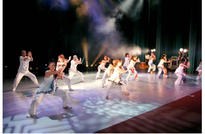
ケイブロードウェイ