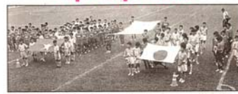
Quang cảnh lễ hội mở "Giáo hội bóng đá thiếu nhi Việt - Nhật" trên sân Thánh Long.