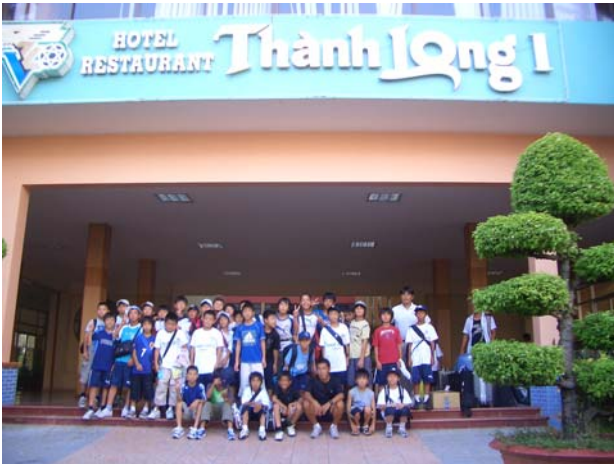
日本少年サッカーチーム