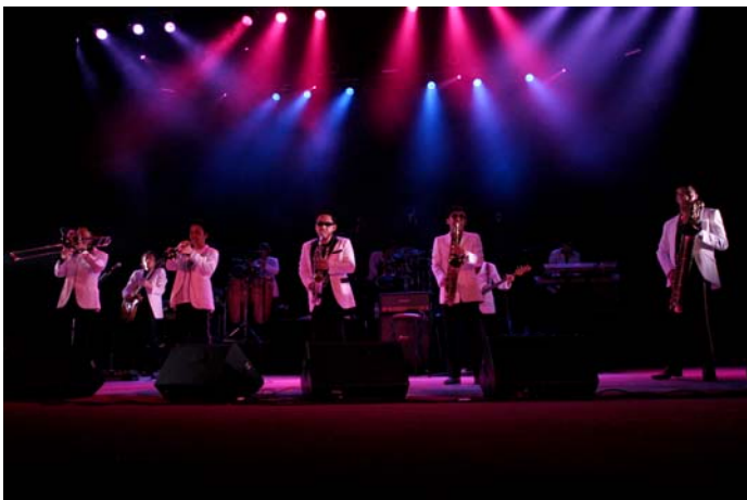
東京スカパラダイスオーケストラ