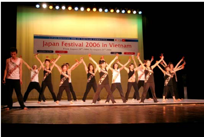
バンブーレボリューション