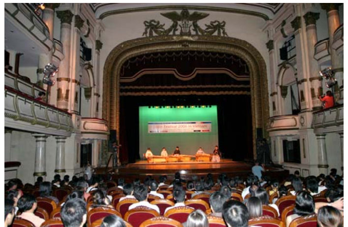
オペラハウス会場