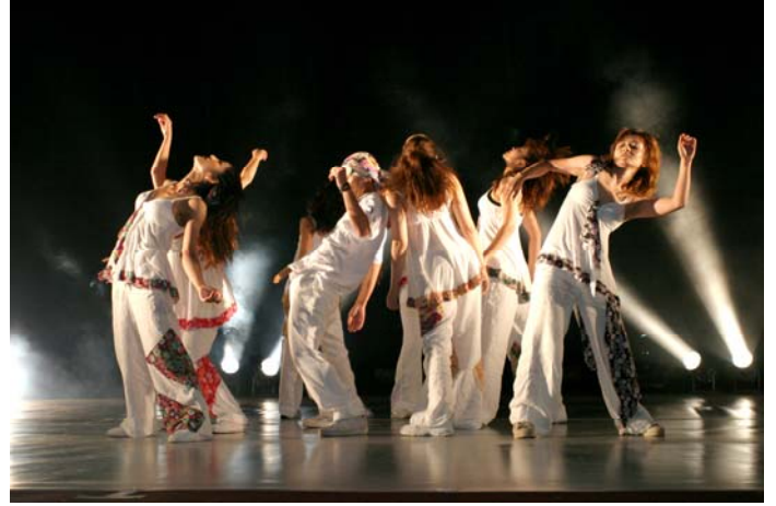
ケイブロードウェイ