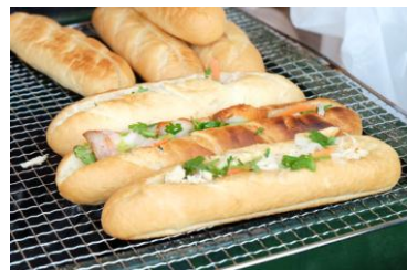
日本でも大人気のベトナム風サンドイッチ「バンミー」。