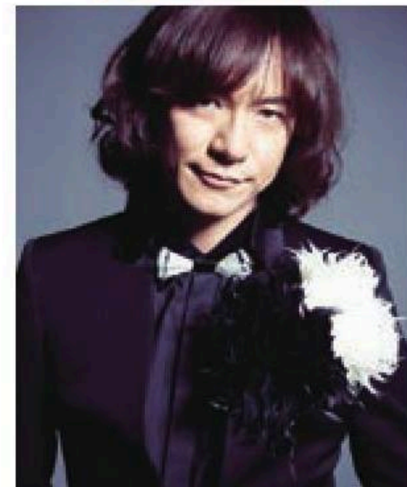
ダイヤモンド☆ユカイ