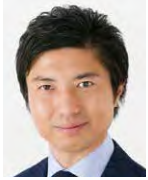
共同委員長 青柳陽一郎 衆議院議員