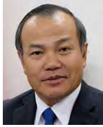
実行委員長 ヴー・ホン・ナム 駐日ベトナム大使