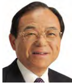
最高顧問 松田岩夫 元国務大臣