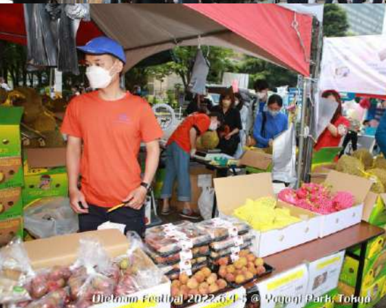
Vietnam Festival 2022.6.4-5 @ Yoyogi Park, Tokyo