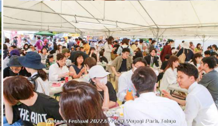
Vietnam Festival 2022.6.4-5 @ Yoyogi Park, Tokyo