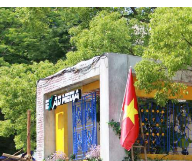
Vietnam Festival 2022.6.4-5 @ Yoyogi Park, Tokyo