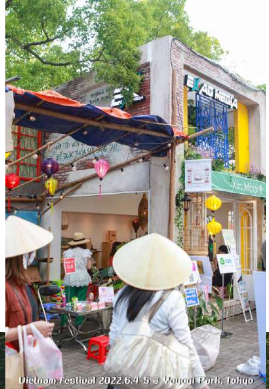
Vietnam Festival 2022.6.4-5 @ Yoyogi Park, Tokyo