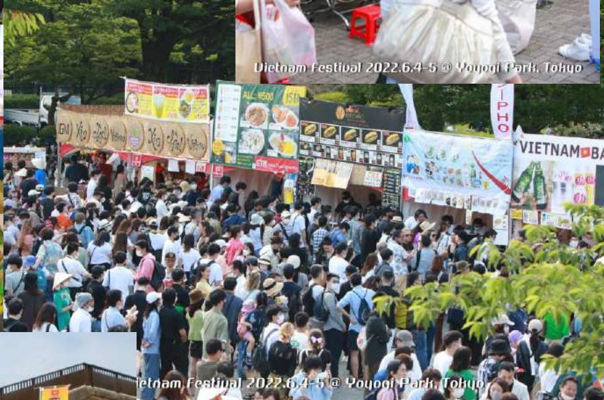
Vietnam Festival 2022.6.4-5 @ Yoyogi Park, Tokyo