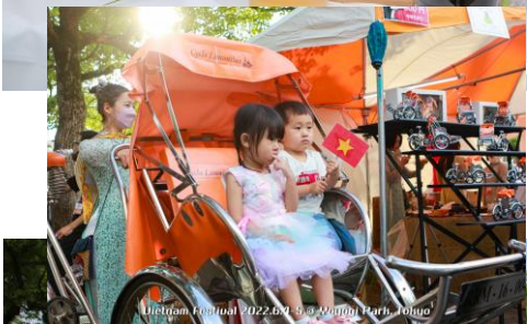
Vietnam Festival 2022.6.4-5 @ Yoyogi Park, Tokyo