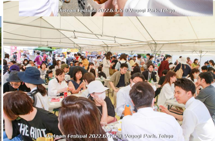
Vietnam Festival 2022.6.4-5 @ Yoyogi Park, Tokyo