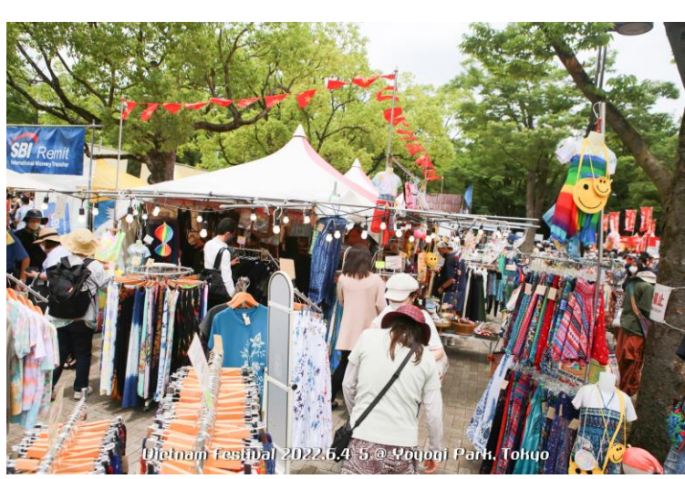
Vietnam Festival 2022.6.4-5 @ Yoyogi Park, Tokyo