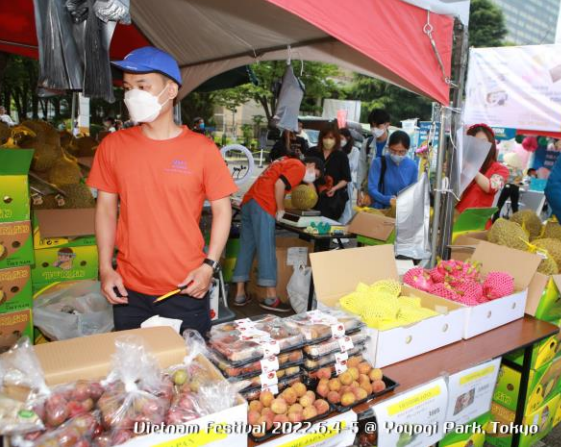
Vietnam Festival 2022.6.4-5 @ Yoyogi Park, Tokyo