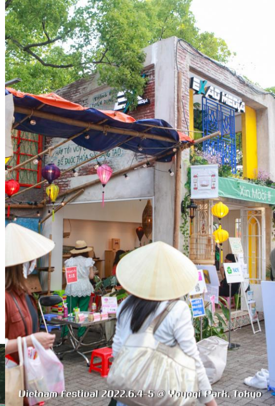
Vietnam Festival 2022.6.4-5 @ Yoyogi Park, Tokyo