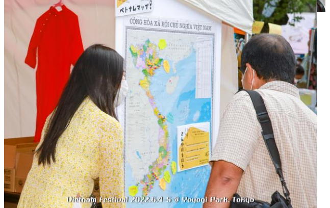
Vietnam Festival 2022.6.4-5 @ Yoyogi Park, Tokyo