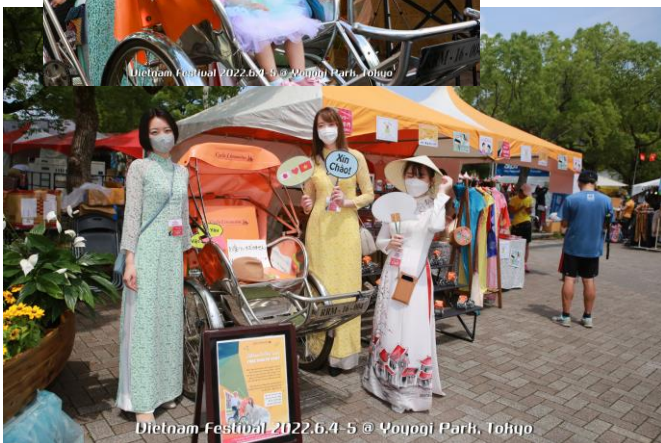
Vietnam Festival 2022.6.4-5 @ Yoyogi Park, Tokyo