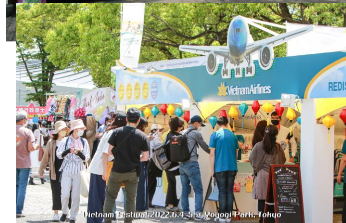
Vietnam Festival 2022.6.4-5 @ Yoyogi Park, Tokyo