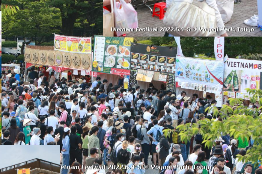
Vietnam Festival 2022.6.4-5 @ Yoyogi Park, Tokyo