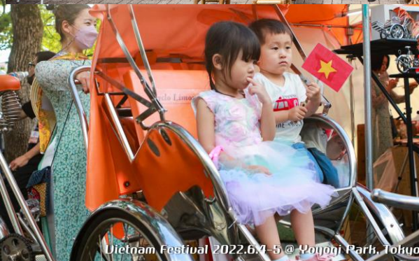
Vietnam Festival 2022.6.4-5 @ Yoyogi Park, Tokyo