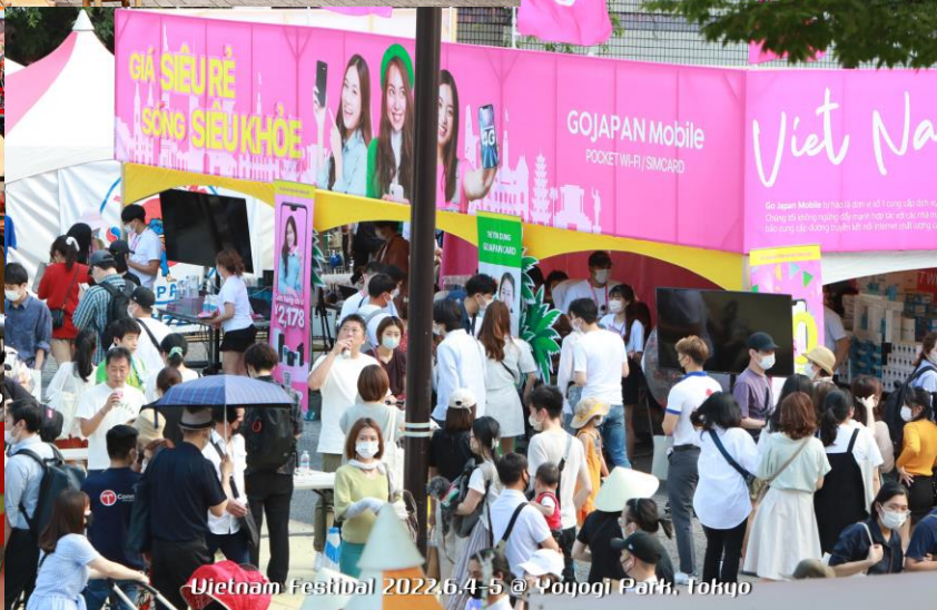
Vietnam Festival 2022.6.4-5 @ Yoyogi Park, Tokyo