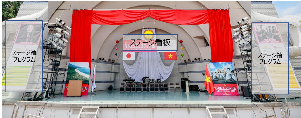
メインステージロゴ掲載イメージ