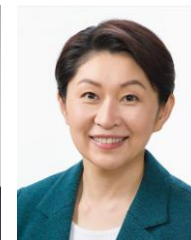
会長 小淵優子 衆議員議員