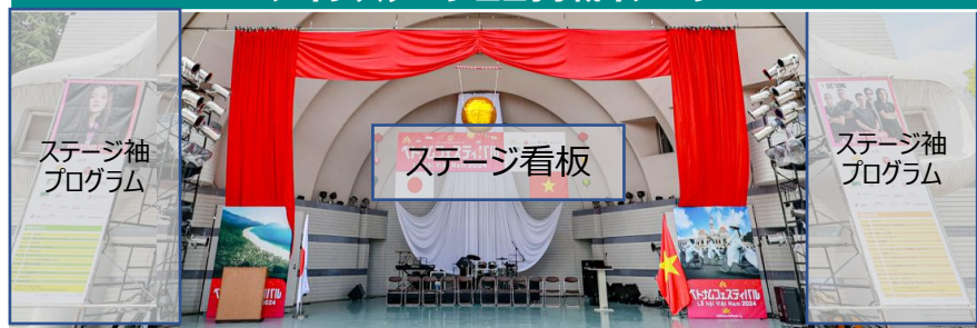
メインステージロゴ掲載イメージ