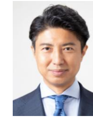
共同委員長 青柳陽一郎 前衆議院議員