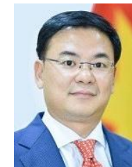
実行委員長 ファムクアンヒエウ 駐日ベトナム大使