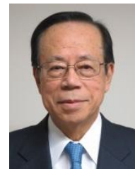
最高顧問 福田康夫 元内閣総理大臣