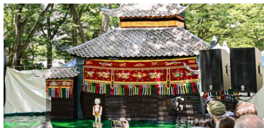
昨年の水上人形劇の様子